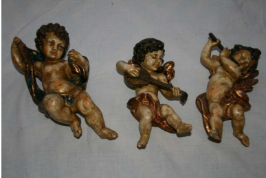
Een trio musicerende engelen