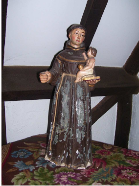
Sint Antonius, Patroon van de Verloren Voorwerpen, gewoonlijk afgebeeld met een bijbel en het kindje Jezus op de arm.