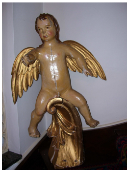
Engel op schelp