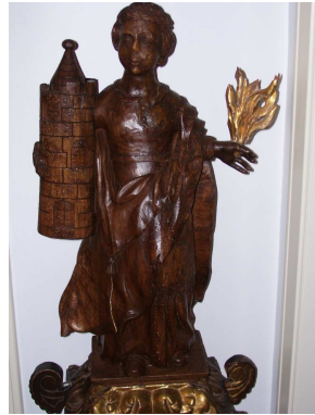
Sint Barbara met de Toren, Patroonheilige van o.a. de Artillerie!