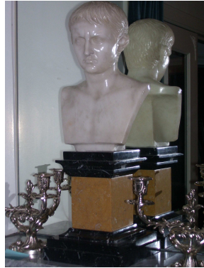
Borstbeeld van onbekende Romein