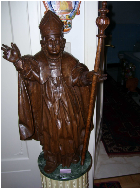
Onbekende bisschop, misschien Sint Maarten of Sint Niklaas?