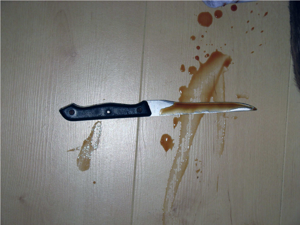
Op de plaats delict is dit bebloede mes aangetroffen, het vermoedelijke moordwapen