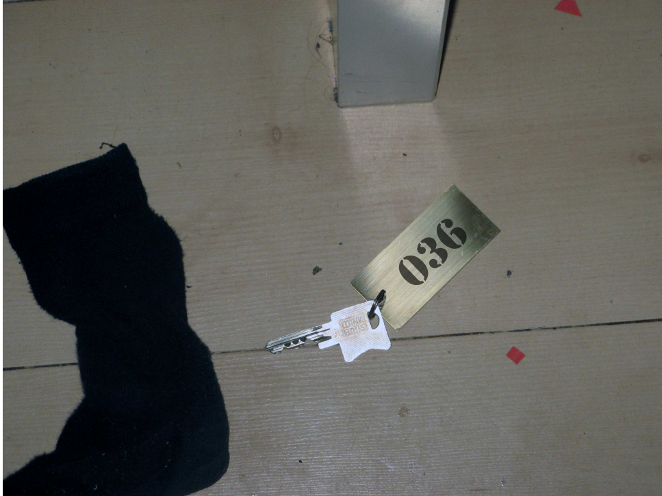
Plaats delict: Hotelkamersleutel nummer 036