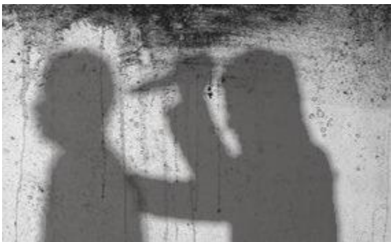
Eagle van Wieshoofd